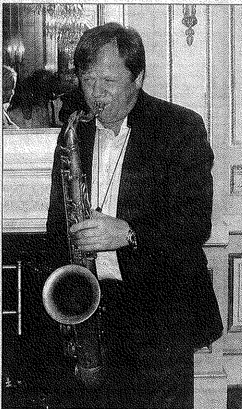
Американский джаз в Российском консульстве. Играл Игорь Бутман.

Стоит отметить, что такие вечера в Российском консульстве каждый раз радуют своих гостей приятными сюрпризами в лице известных артистов, певцов, музыкантов. В разные годы нам представлялась возможность пообщаться с создателями фильма "Москва слезам не верит" Владимиром Меньшовым и Верой Алентовой, лауреатами премии "Золотой граммофон". Ну а в этот раз вечер приобрел ярко выраженный джазовый характер. В консульство приехали народная артистка России Лариса Долина и замечательный музыкант Игорь Бутман, чьи концерты в Нью-Йорке прошли сейчас с полными аншлагами.